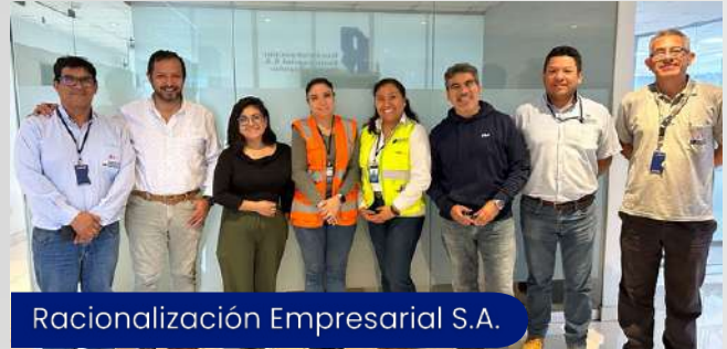
Racionalización Empresarial S.A.