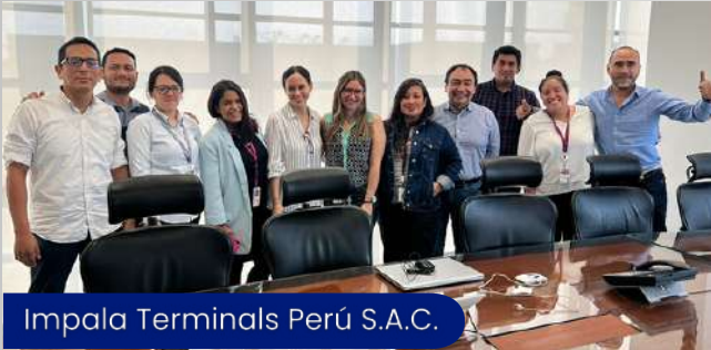
Impala Terminals Perú S.A.C.