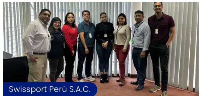
Swissport Perú S.A.C.