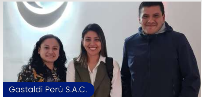
Gastaldi Perú S.A.C.