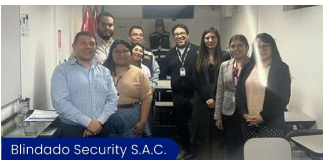
Blindado Security S.A.C.