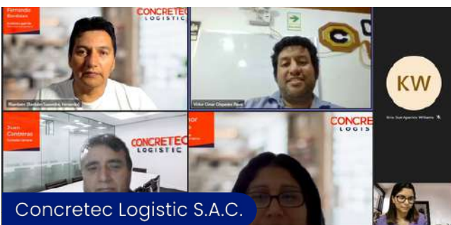
Concretec Logistic S.A.C.