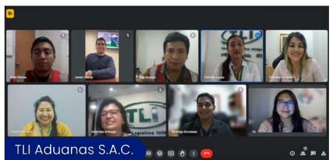
TLI Aduanas S.A.C.