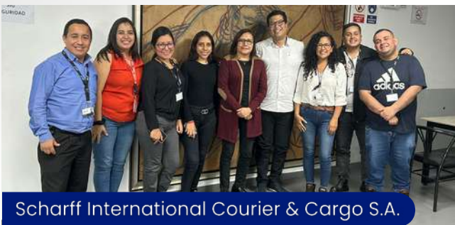
Scharff International Courier & Cargo S.A.