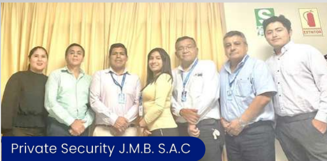
Private Security J.M.B. S.A.C